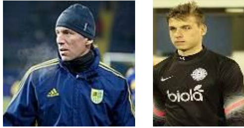
Фото № 2 Наші батьки – орієнтири в світі футболу